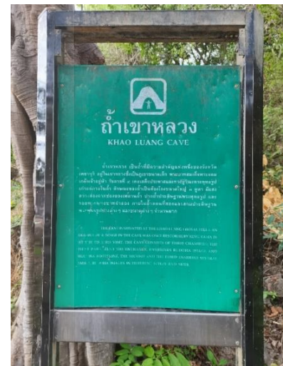
ภาพที่ 4 ถ้ำเขาหลวง อำเภอคลองกระแซง อำเภอเมืองเพชรบุรี จังหวัดเพชรบุรี

นิราศเมืองเพชรสะท้อนให้เห็นถึงการเดินทางไปยังสถานที่ต่าง ๆ สะท้อนให้เห็นถึงวิถีชีวิตความเป็นอยู่ จากบ้าน วัด สุวังคติความเชื่อ ต่าง ๆ ของคนในสมัยก่อนในมิติแห่งวัฒนธรรมต่าง ๆ ผู้วิจัยมีความเห็นว่า เอกลักษณ์ทางวรรณกรรมนิราศเมืองเพชรบุรีของสุนทรภู่ สามารถส่งเสริมการท่องเที่ยวเชิงวัฒนธรรมตำบลคลองกระแซง อำเภอเมืองเพชรบุรี จังหวัดเพชรบุรีอย่างยั่งยืนได้ ซึ่งสถานที่ท่องเที่ยวต่าง ๆ ที่มีบันทึกในนิราศเมืองเพชร ของสุนทรภู่ ในปัจจุบันได้กลายเป็นสถานที่ท่องเที่ยวที่นิยมในจังหวัดเพชรบุรี แสดงให้เห็นว่า นิราศเมืองเพชร เต็มเปี่ยมด้วยอิสระแห่งกวีในการถ่ายทอดพลังทางวรรณศิลป์โดยไม่ยึดติดกับกรอบขนบนิราศ ผู้วิจัยจึงสนใจที่จะศึกษาถึงแนวทางการพัฒนาการใช้วรรณกรรมนิราศเมืองเพชรบุรีของสุนทรภู่ เพื่อประโยชน์ในการพัฒนาการท่องเที่ยว เชิงภูมิศาสตร์ เชิงประวัติศาสตร์ และเชิงวัฒนธรรม และยังส่งเสริมให้คนรุ่นหลังเห็นคุณค่าและความสำคัญของวรรณกรรม รู้จักรักและหวงแหน รวมทั้งอนุรักษ์ให้คงอยู่ต่อไป