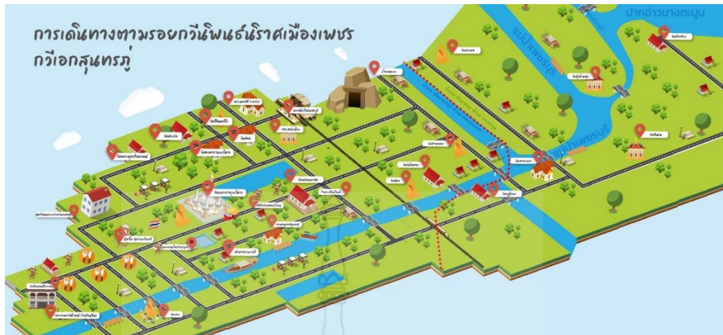
ภาพที่ 2 การเดินทางตามรอยกวีนินห์นราศเมืองเพชร กวีเอกสุนทรภู่

เส้นทางในนิราศ การเดินทางเริ่มต้นออกจากท่าเรือหน้าวัดอรุณราชวรารามไปทางคลอง บางกอกใหญ่ คลองบางลำเจียก คลองขวาง คลองมหาไชยออกแม่น้ำท่าจีน เข้าคลองสามสิบสองคด คลองสุนัขหอน ออกแม่น้ำแม่กลองไปปากอ่าว ปากคลองโคกนาค ปากคลองช่อง ข้ามอ่าวยี่สามน เข้าคลอง ตะบูน ถึงเพชรบุรี ซึ่งสถานที่สำคัญที่กวีเอกสุนทรภู่ได้เดินทางมายังจังหวัดเพชรบุรี ได้แก่