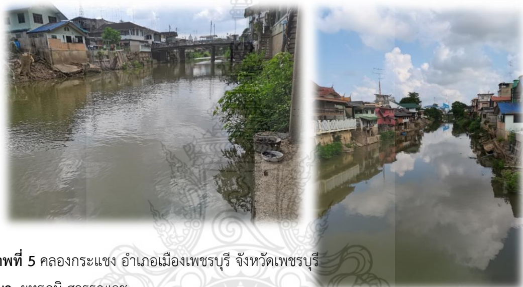
ภาพที่ 5 คลองกระแซง อำเภอมืองเพชรบุรี จังหวัดเพชรบุรี

คือ “พระรามราชนิเวศน์” หรือที่เรียกกันว่า “วังบ้านปืน” และพระบาทสมเด็จพระมงกุฎเกล้าเจ้าอยู่หัวก็ได้โปรดให้สร้างพระราชวัง “พระราชนิเวศน์มฤคทายวัน” ขึ้นที่ชายหาดชะอำในเวลาต่อมาเพื่อใช้เป็นที่ประทับรักษาพระองค์ ด้วยทรงเชื่อว่า อากาศชายทะเลและน้ำทะเลอาจบรรเทาอาการเจ็บป่วยได้ จังหวัดเพชรบุรีจึงถูกเรียกอีกชื่อหนึ่งว่า “เมืองสามวัง” นับแต่นั้นมา ปัจจุบันจังหวัดเพชรบุรีแบ่งการปกครองออกเป็น 8 อำเภอ คือ อำเภอเมืองเพชรบุรี อำเภอเขาย้อย อำเภอหนองหญ้าปล้อง อำเภอชะอำ อำเภอท่ายาง อำเภอบ้านลาด อำเภอบ้านแหลม และอำเภอแก่งกระจาน