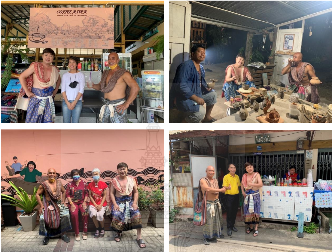
ภาพที่ 11 การลงพื้นที่สัมภาษณ์คนในชุมชนคลองกระแชง อำเภอเมือง จังหวัดเพชรบุรี

ด้านความสนใจในการนำนิราศเมืองเพชรมาใช้ส่งเสริมการท่องเที่ยวเชิงวัฒนธรรม โดยแบ่งออกเป็น 2 ด้าน ได้แก่