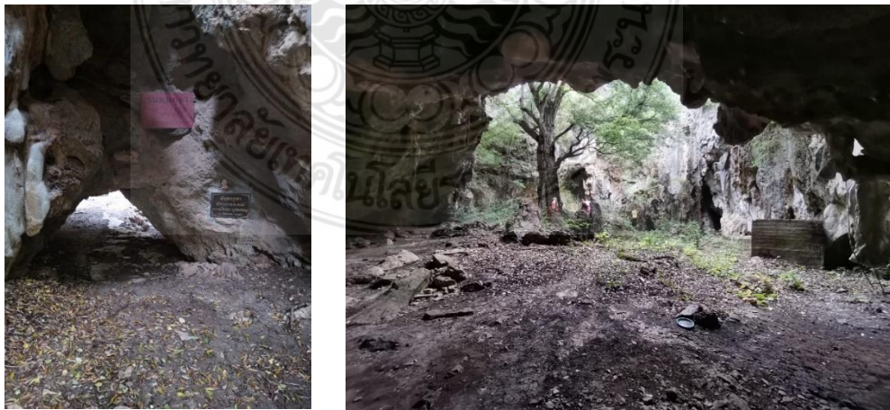
ภาพที่ 3 ถ้ำจัน อำเภอบางแพะ จังหวัดเพชรบุรี

ถ้ำจันเป็นแหล่งท่องเที่ยวที่มีหินงอกหินย้อยตามธรรมชาติที่ลดหลั่นกันเหมือนเตี้ยตั้งอัน วิจิตรตระการตาอย่างสวยงาม นอกจากนี้ภายในถ้ำยังมีต้นจันขนาดใหญ่ อายุหลายร้อยปีหลายคน โอบ ยืนต้นตระหง่านแผ่กิ่งก้านเป็นร่มฉัตรเหนือปล่องถ้ำ ทอดเงาพื่อให้แสงลอดลงมากระทบพื้นดิน อย่างสวยงามอีกด้วย