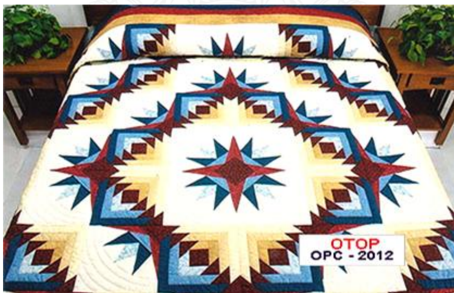
รูปที่ 3 ผลิตภัณฑ์ผ้าคลุมเตียงผลิตภัณฑ์ OTOP ตำบลช่อแฮ อำเภอเมือง จังหวัดแพร่