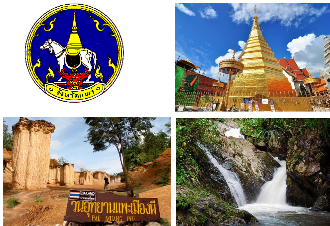
รูปที่ 4 แสดงลักษณะของเอกลักษณ์ประจำจังหวัดแพะ