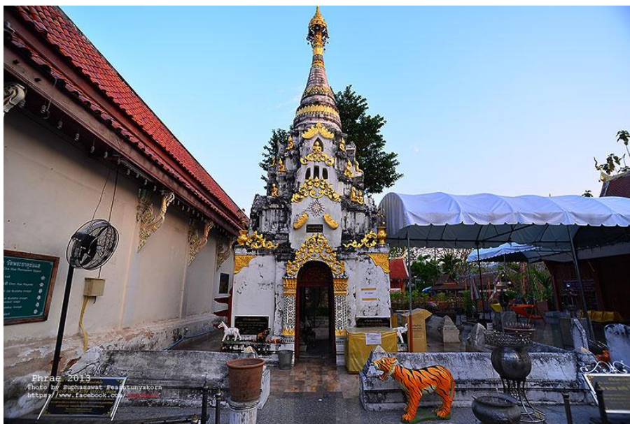
รูปที่ 7 แสดงภาพของพระเจ้าทันใจที่นักท่องเที่ยวนิยมไปสักการะขอพร