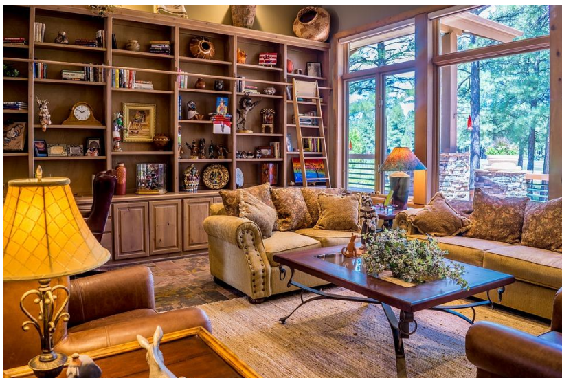
รูปที่ 2.18 แสดงภาพเฟอร์นิเจอร์จากผ้าไทย

อุบลราชธานี ผู้วิจัยจึงเห็นถึงความงามและคุณค่าแห่งการอนุรักษ์จึงได้นำมาออกแบบเป็นเฟอร์นิเจอร์ในการตกแต่งบ้านดังกล่าว