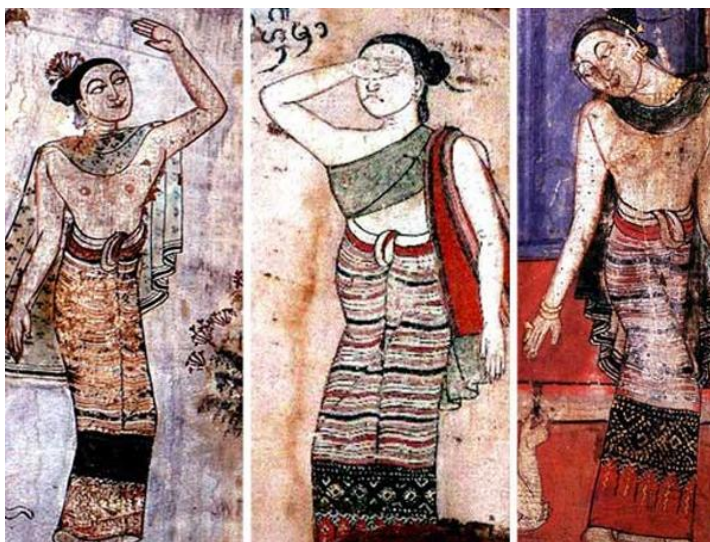
รูปที่ 2.1 แสดงภาพบนฝาผนังผู้หญิงสมัยก่อนสวมใส่ผ้าตีนจก

ร้อยปี หลักฐานคือภาพจิตรกรรมฝาผนังที่ วัดเวียงต้า ตำบลเวียงต้า อำเภอลอง เป็นภาพวิถีชีวิตความเชื่อการแต่งกายของชาวบ้านเวียงต้าซึ่งเป็นคนเมืองลงในยุคนั้น ผู้หญิงในภาพใช้สวมใส่เป็นชิ้นตีนจก ผ้าจกเมืองลองเป็นผ้าทอที่มีลวดลายและสีที่งดงาม ในอดีตส่วนใหญ่เป็นการทอเพื่อนำมาต่อกับผ้าถุงหรือที่เรียกว่า “ซิ่น” เป็นเชิงตีนซิ่น เรียกว่า “ซิ่นตีนจก” และมีการสืบทอดวัฒนธรรมการทอผ้าตีนจกมาจนถึงปัจจุบัน ที่มีความสวยงามบอกถึงฐานะและสังคมของผู้สวมใส่