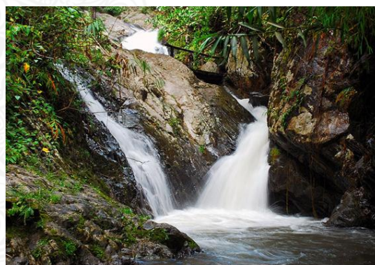
รูปที่ 2.5 แสดงลักษณะของเอกลักษณ์ประจำจังหวัดแพร่