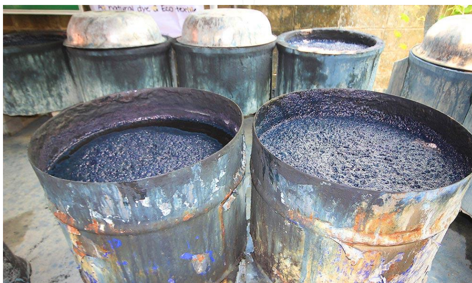
รูปที่ 5 ถังสีย้อมหม้อฮ่อมธรรมชาติจากต้นห้อม

เชื้อสายลาวพวน ซึ่งได้อพยพเข้ามาอยู่ที่บ้านทุ่งไธ้กันแล้ว และได้นำเอาวัฒนธรรมการทอผ้าและการย้อมผ้า โดยใช้ต้นและใบห้อมมาย้อม ทำให้ผ้าฝ้ายเกิดเป็นสีครามหรือสีกรมท่า ซึ่งเป็นการย้อมแบบดั้งเดิม แต่ไม่มีหลักฐานการบันทึกว่า เริ่มทำกันมาตั้งแต่เมื่อไหร่ แต่คาดว่าน่าจะมีการทำมาหลายชั่วอายุคน โดยการทอสีบทยอดกันมาตั้งแต่รุ่น พ่อ - แม่ ซึ่งผ้าห้อมฮ่อม เป็นชื่อผ้าย้อมพื้นเมืองสีกรมท่าที่สร้างชื่อเสียงให้กับเมืองแพร่มานานแล้ว ในอดีตผ้าห้อมฮ่อมเป็นผ้าฝ้ายทอมือ ที่นำดอกฝ้ายขาวมาทำเป็นเส้นใยแล้วทอด้วยกี่พื้นเมืองเป็นผ้าพื้นสีขาว หลังจากนั้นจึงนำไปตัดเย็บให้เป็นเสื้อแบบต่าง ๆ กางเกงเตี่ยวสะตอ จากนั้นนำมาย้อมในน้ำฮ่อม ที่ได้จากการหมักต้นฮ่อมเอาไว้ในหม้อในปัจจุบันมีการทอผ้าด้วยกี่แบบพื้นเมืองน้อยลงทำให้ผ้าทอมีราคาแพง ในการตัดเย็บเสื้อผ้าห้อมฮ่อมจึงมีการใช้ผ้าดิบจากโรงงานตัดเย็บ ย้อมด้วยน้ำฮ่อมธรรมชาติหรือสีห้อมฮ่อมมหาวิทยาลัย