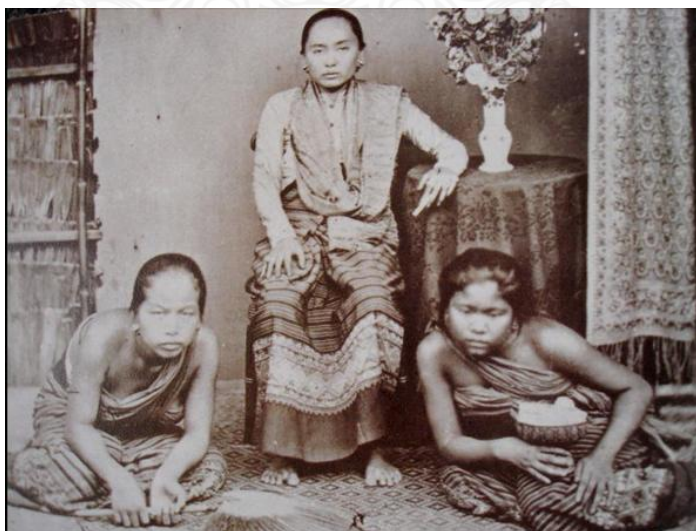
รูปที่ 2.2 แสดงภาพเจ้านายชั้นสูงสมัยก่อนสวมใส่ผ้าซิ่นตีนจก