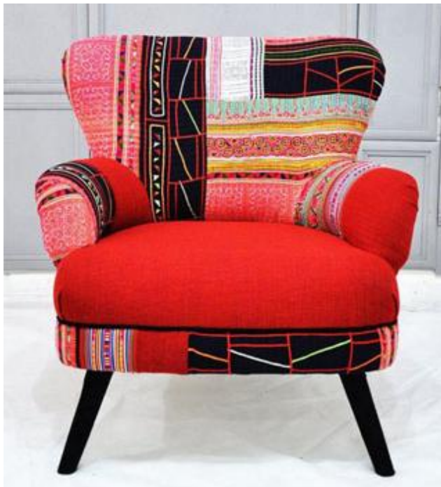
รูปที่ 2.20 แสดงภาพเก้าอี้ผ้าฝ้ายทอมือ

ครีเอทีฟ เฟอร์นิเจอร์ผ้าไหม เป็นเฟอร์นิเจอร์สไตล์ไทยๆ เก้าอี้ผ้าไหมทรงลูกเต๋าแบบนี้ เอาไปวางล้อมโต๊ะกลมสำหรับนั่งเล่น