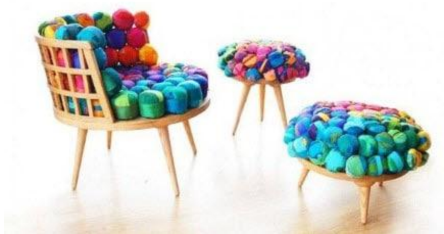
รูปที่ 2.22 แสดงภาพเก้าอี้ไม้ไอ้ค มีรูปทรงเรียบง่าย