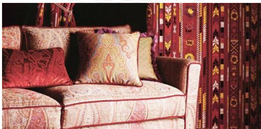
รูปที่ 2.19 แสดงภาพผ้าม่านผ้าไหมเข้าชุดกับโซฟาผ้าไหม

ผ้าม่านผ้าไหมเข้าชุดกับโซฟาผ้าไหม โทนใจคนชอบลายสไตล์พื้นเมืองกันสุดๆ ด้วยโซฟา หมอน และผ้าม่านเข้าชุดกัน ทั้งหมดล้วนทำจากผ้าไหม มีเสน่ห์สุดๆ ใครชอบสไตล์นี้พลาดไม่ได้แล้ว