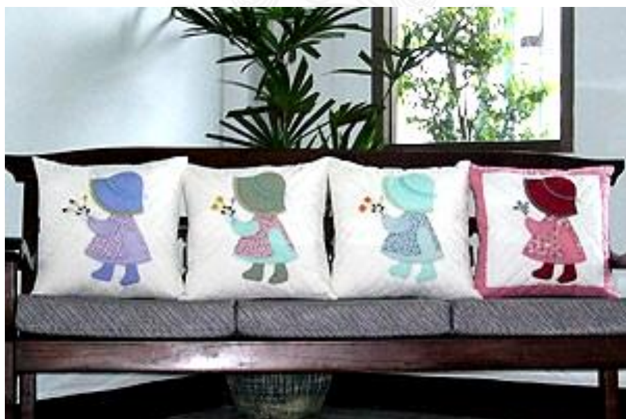
รูปที่ 1 แสดงลักษณะของผ้าตัดมือที่มีการออกแบบลวดลายอิสระและเย็บด้วยมือทั้งผืน