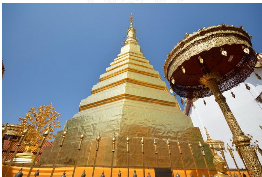
รูปที่ 6 แสดงภาพของพระธาตุช่อแฮ