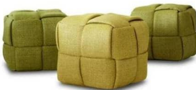
รูปที่ 2.21 แสดงภาพ ครีเอทีฟ เฟอร์นิเจอร์ผ้าไหม

ครีเอทีฟ เฟอร์นิเจอร์ผ้าไหม เป็นเฟอร์นิเจอร์สไตล์ไทยๆ เก้าอี้ผ้าไหมทรงลูกเต๋าแบบนี้ เอาไปวางล้อมโต๊ะกลมสำหรับนั่งเล่น