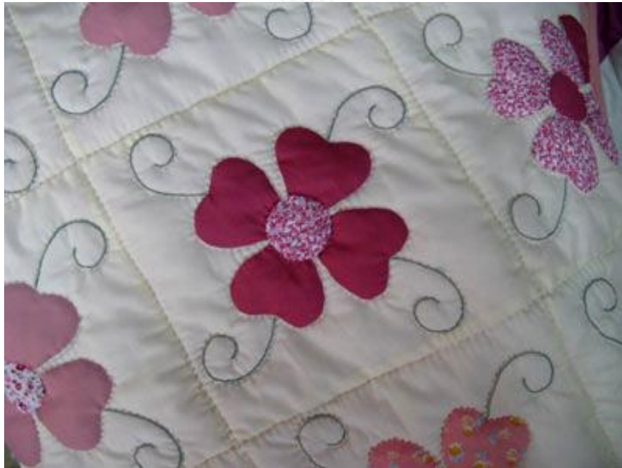
รูปที่ 1 แสดงลักษณะของผ้าตัดมือที่มีการออกแบบลวดลายอิสระและเย็บด้วยมือทั้งผืน

การทำผ้าตัดมือในสมัยก่อนเมื่อครั้งที่ยังไม่มีจักรเย็บผ้า ชาวบ้านได้ใช้เข็มกับด้ายช่วยในการเย็บและซ่อมแซมเสื้อผ้า เครื่องนุ่งห่มโดยใช้วิธีเนาสวย ปักชุนด้วยมือมาโดยตลอดโดยไม่มีการประยุกต์ใช้เครื่องทุ่นแรงหรืออุปกรณ์อื่นๆต่อมาเมื่อ ๒๐ กว่าปีที่ผ่านมาการตัดผ้าได้มีขึ้นครั้งแรกในกลุ่มสตรีชาวคริสต์จักรสามัคคีธรรมที่ ๕ เท่านั้น ต่อมาได้ขยายว่าจ้างกลุ่มสตรีในหมู่บ้านใกล้เคียงรับงานไปทำที่บ้านต่อมา ปี ๒๕๔๕เทศบาลตำบลช่อแฮ ได้สนับสนุนงบประมาณตามโครงการกระตุ้นเศรษฐกิจ สนับสนุนหัตถกรรมผ้าตัดมือการทำผ้าตัดมือในสมัยก่อนเมื่อครั้งที่ยังไม่มีจักรเย็บผ้า ชาวบ้านได้ใช้เข็มกับด้ายช่วยในการเย็บและซ่อมแซมเสื้อผ้า เครื่องนุ่งห่มโดยใช้วิธีเนาสวย ปักชุนด้วยมือมาโดยตลอดโดยไม่มีการประยุกต์ใช้เครื่องทุ่นแรงหรืออุปกรณ์อื่นๆ