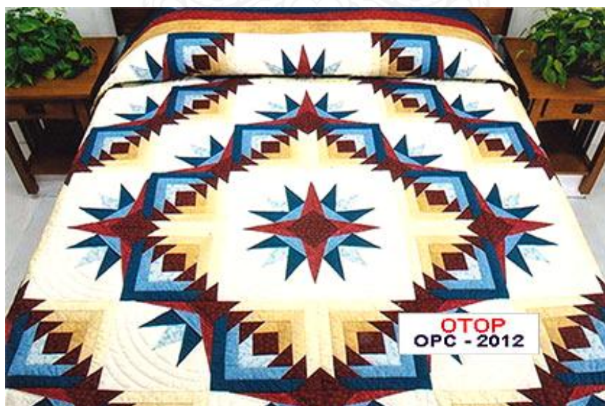
รูปที่ 3 ผลิตภัณฑ์ผ้าคลุมเตียงผลิตภัณฑ์ OTOP ตำบลช่อแฮ อำเภอเมือง จังหวัดแพร่

ต่อมาเมื่อ ๒๐ กว่าปีที่ผ่านมามีการดัดผ้าได้มีขึ้นครั้งแรกในกลุ่มสตรีชาวคริสต์จักรสามัคคีธรรมที่ ๕ เท่านั้น ต่อมาได้ขยายว่าจ้างกลุ่มสตรีในหมู่บ้านใกล้เคียงรับงานไปทำที่บ้านต่อมา ปี ๒๕๔๕เทศบาลตำบลช่อแฮ ได้สนับสนุนงบประมาณตามโครงการกระตุ้นเศรษฐกิจ