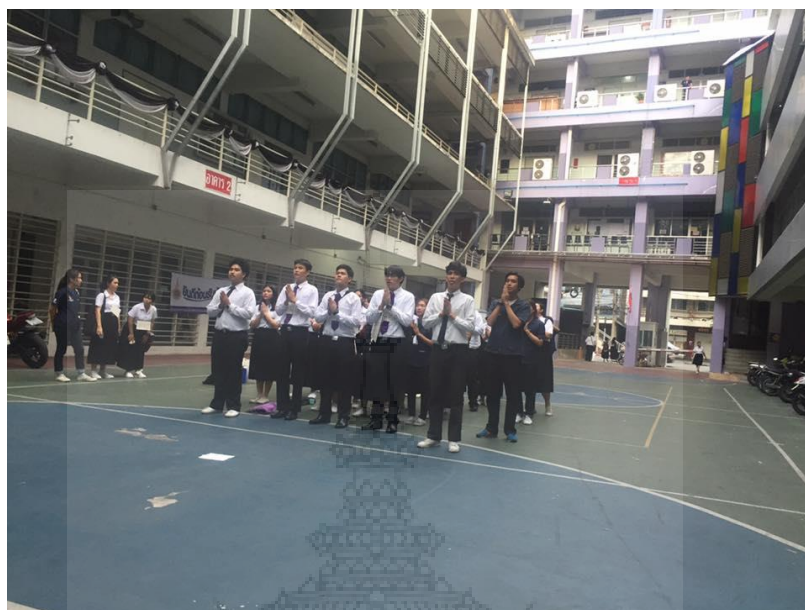
ภาพประกอบที่ 3 นักศึกษารุ่นน้องร่วมกันเข้าแถวเพื่อทอองบทสักการบูชา ศาลกรมหลวงชุมพรเขตอุดมศักดิ์