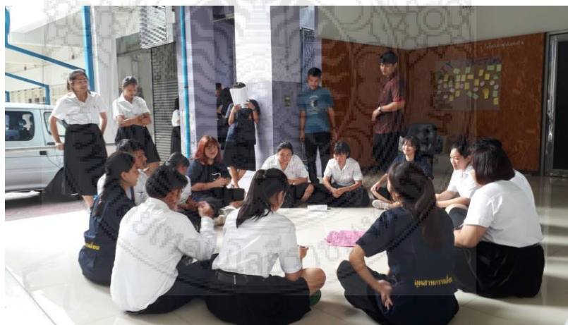
ภาพประกอบที่ 8 กิจกรรมเขียนความประทับใจซึ่งรุ่นพี่จะให้รุ่นน้องได้เขียนความประทับใจและสิ่งที่ไม่ประทับใจในการเข้าร่วมกิจกรรมต้อนรับน้องใหม่อย่างสร้างสรรค์เพื่อจะได้นำมาปรับปรุงและพัฒนาการจัดกิจกรรมในปีต่อไป