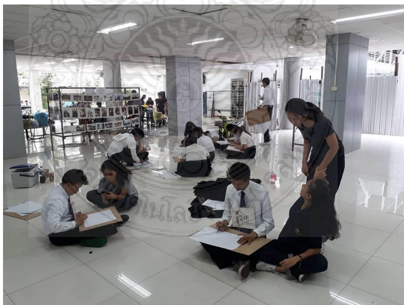
ภาพประกอบที่ 14 นักศึกษารุ่นพี่ชวนกันสอนทักษะการวาดภาพให้กับนักศึกษารุ่นน้อง