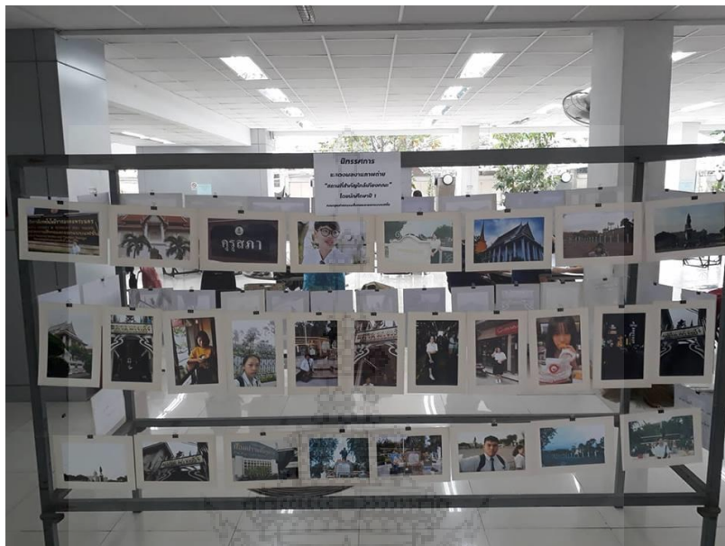
ภาพประกอบที่ 9 กิจกรรมประกวดการถ่ายภาพสถานที่สำคัญและแหล่งท่องเที่ยวที่อยู่ใกล้พื้นที่ศูนย์พณิชยการพระนคร ซึ่งเป็นส่วนหนึ่งของกิจกรรมต้อนรับน้องใหม่อย่างสร้างสรรค์เพื่อเป็นการให้นักศึกษาได้รู้จักสถานที่สำคัญและแหล่งท่องเที่ยวต่างๆ