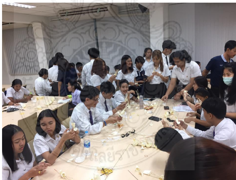
ภาพประกอบที่ 2 กิจกรรมการประดิษฐ์ดอกไม้จันทน์ เนื่องในพิธีถวายพระเพลิงพระบรมศพ ในหลวงรัชกาลที่ 9 ซึ่งเป็นส่วนหนึ่งของกิจกรรมต้อนรับน้องใหม่อย่างสร้างสรรค์ โดยมีนักศึกษารุ่นพี่เป็นผู้ถ่ายทอดวิธีการประดิษฐ์ในครั้งนี้