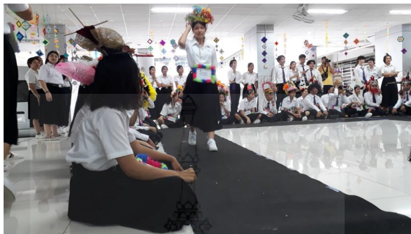
ภาพประกอบที่ 11 กิจกรรมเดินแฟชั่นโชว์ของนักศึกษาปี1 เพื่อเป็นฝึกทักษะและฝึกความคิดสร้างสรรค์ในการแสดงออกซึ่งเป็นส่วนหนึ่งของกิจกรรมต้อนรับน้องใหม่อย่างสร้างสรรค์