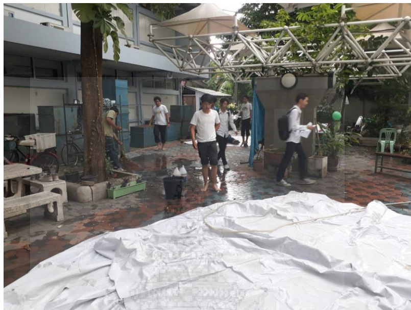
ภาพประกอบที่ 7 หลังจากเสร็จกิจกรรมกลุ่มสัมพันธ์ซึ่งเป็นหนึ่งในกิจกรรมต้อนรับน้องใหม่อย่างสร้างสรรค์นักศึกษาทั้งรุ่นพี่และรุ่นน้องต่างช่วยกันทำความสะอาดบริเวณคณะฯ