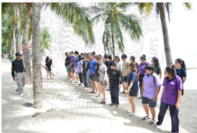
ภาพประกอบที่ 16 กิจกรรมเข้าฐานฝึกความเป็นผู้นำนักศึกษาก่อนที่จะกลับมาจัดกิจกรรมต้อนรับน้องใหม่อย่างสร้างสรรค์โดยวิทยากรที่มีความรู้ความสามารถ