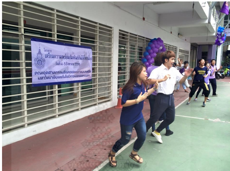
ภาพประกอบที่ 13 รุ่นพี่ทุกคนจะมีส่วนร่วมในกิจกรรมต้อนรับน้องใหม่อย่างสร้างสรรค์เพื่อทำให้เกิดการเชื่อมความสัมพันธ์ที่ดีระหว่างรุ่นพี่และรุ่นน้อง