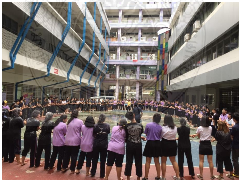
ภาพประกอบที่ 10 นักศึกษาทั้งรุ่นพี่และรุ่นน้องร่วมกันจับมือเป็นวงกลมและร่วมกันร้องเพลงเพื่อเป็นการเชื่อมความสัมพันธ์ซึ่งเป็นกิจกรรมสุดท้ายในการจัดกิจกรรมต้อนรับน้องใหม่อย่างสร้างสรรค์