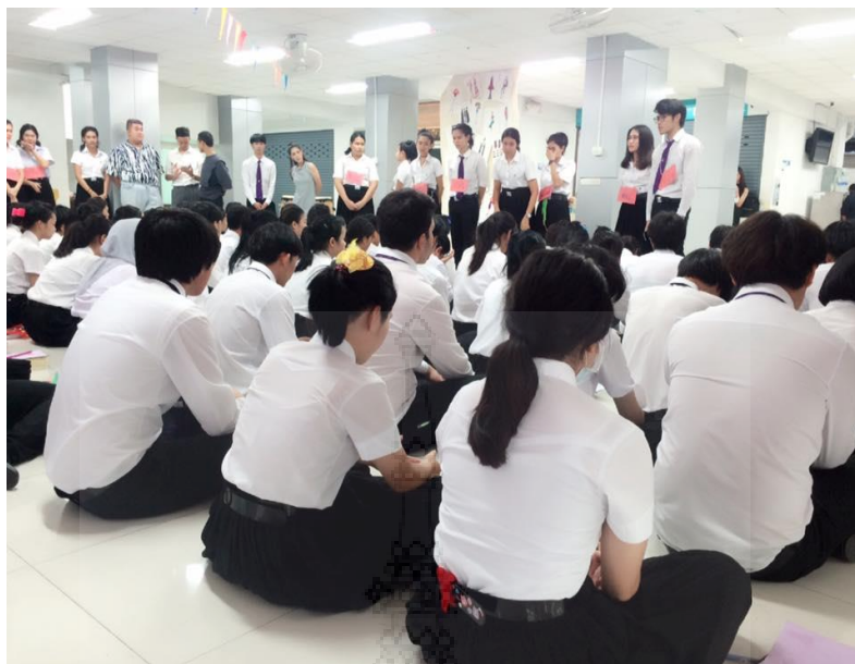
ภาพประกอบที่ 1 เป็นการนำแนะตัวของรุ่นพี่เพื่อให้รุ่นน้องได้รู้จักชื่อของรุ่นพี่แต่ละคน