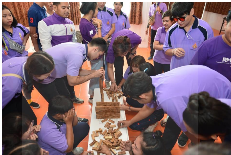
ภาพประกอบที่ 15 ทางคณะมีการจัดโครงการอบรมผู้นำนักศึกษาเพื่อเป็นการเตรียมความพร้อมก่อนที่จะจัดกิจกรรมต้อนรับน้องใหม่อย่างสร้างสรรค์