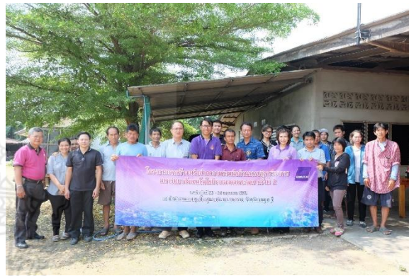
ภาพกิจกรรมลงพื้นที่กลุ่มฟื้นฟูบ้านตาลเสี้ยน ตำบลรางสาลี อำเภอท่าวัง จังหวัดกาญจนบุรี