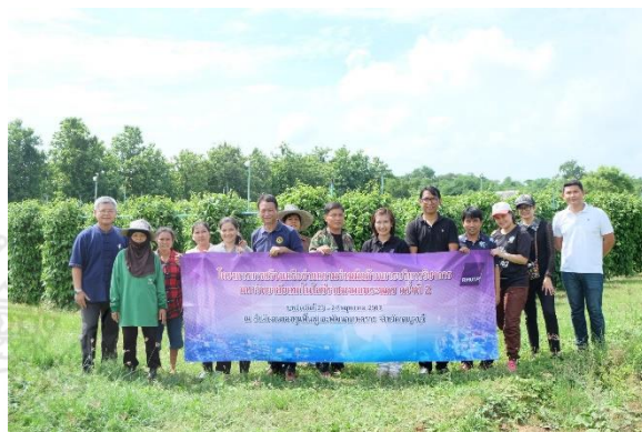
ภาพกิจกรรมลงพื้นที่กลุ่มเบญพาตร์รักษะเกษตรกร ตำบลพังตรุ อำเภอนมทวน จังหวัดกาญจนบุรี