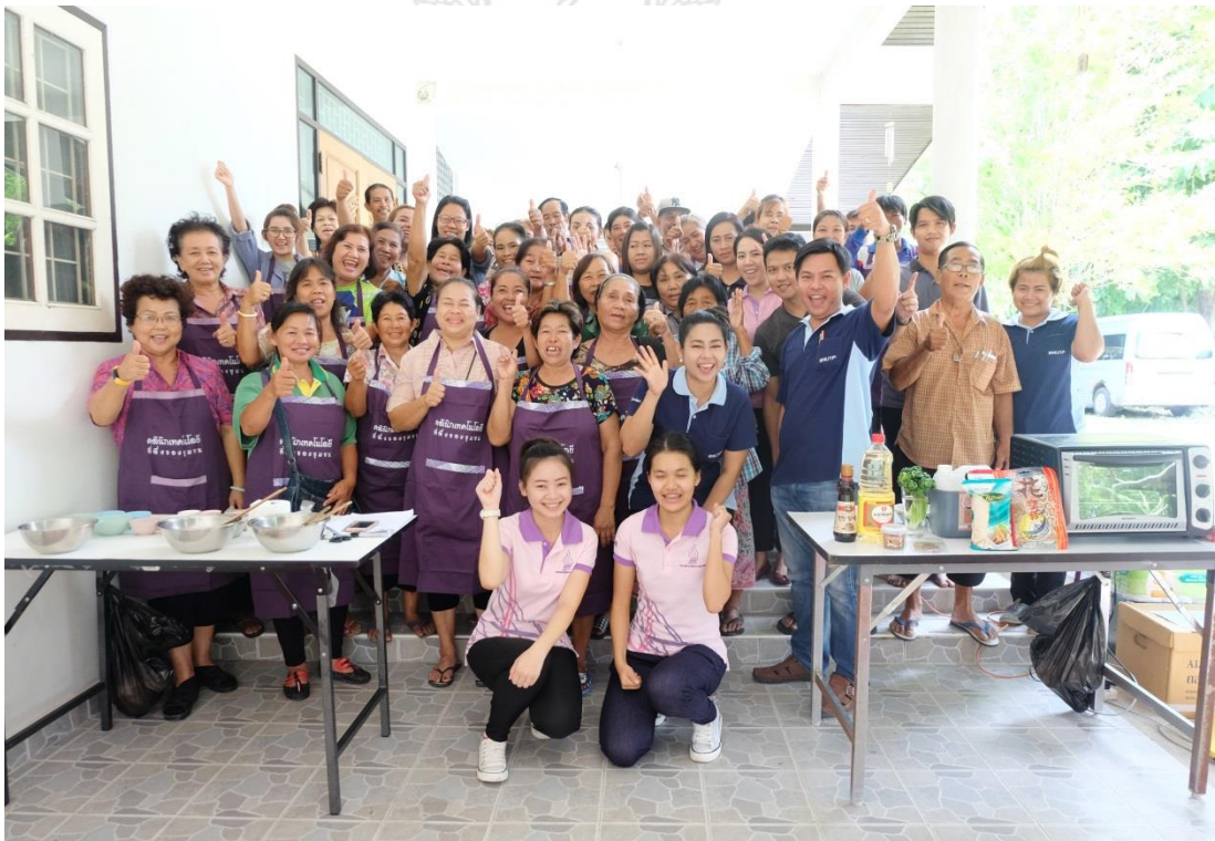
ถ่ายภาพรวมกับผู้เข้าร่วมโครงการ ณ กลุ่มวิสาหกิจชุมชนฐานทรัพย์