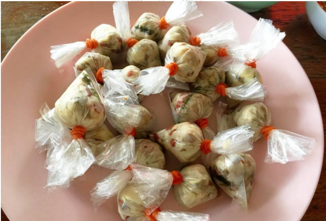
ภาพผลิตภัณฑ์แปรรูปเห็ดเพิ่มเติม คือ ลูกชิ้นเห็ดและแฮมเห็ด