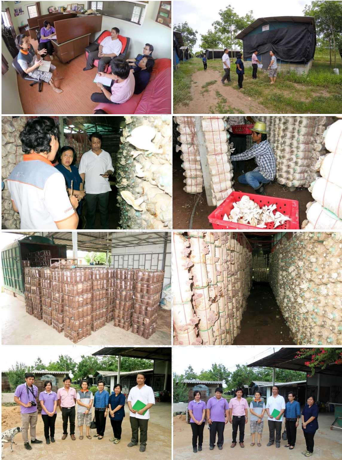
ลงพื้นที่สำรวจความต้องการของกลุ่มวิสาหกิจชุมชนฐานทรัพย์