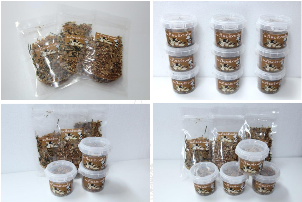
ภาพผลิตภัณฑ์ผงปรุงรสเห็ด ผงชูรสเห็ดใส่บรรจุภัณฑ์