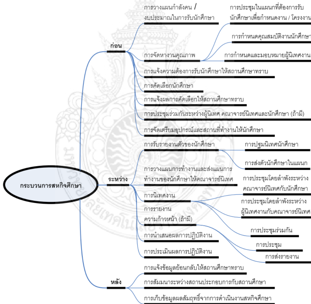
ภาพที่ 2-3 แผนภูมิกระบวนการสหกิจศึกษาของสถานประกอบการ

ภาพที่ 2-3 แสดงแผนภูมิ กระบวนการสหกิจศึกษาของสถานประกอบการ 3 กระบวนการ และแสดงกิจกรรมต่าง ๆ ของแต่ละกระบวนการ