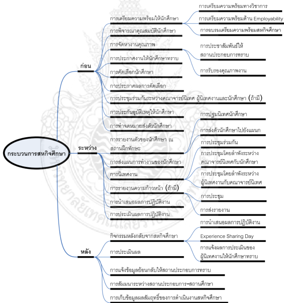
ภาพที่ 2-2 แผนภูมิกระบวนการสหกิจศึกษาของสถานศึกษา

สำหรับกระบวนการสหกิจศึกษาของสถานศึกษาแสดงดังภาพที่ 2-2 จากภาพกระบวนการสหกิจศึกษาแบ่งออกเป็น 3 กระบวน คือ (1) กระบวนการก่อนปฏิบัติงานสหกิจศึกษา (2) กระบวนการระหว่างปฏิบัติงานสหกิจศึกษา และ (3) กระบวนการหลังปฏิบัติสหกิจศึกษา ซึ่งแต่ละกระบวนการประกอบด้วยกิจกรรมต่าง ๆ รายละเอียดดังภาพ