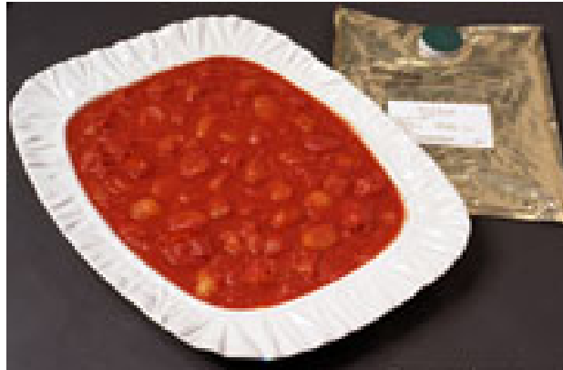
ภาพ 4.1 อาหารพร้อมปรุงสำเร็จที่ผลิตมาจากมะเขือเทศสีดำ

ตัวอย่างการพิมพ์ภาพประกอบ (กรณีที่ถ่ายภาพด้วยตนเอง ไม่นำภาพผู้อื่นมาอ้างอิง)