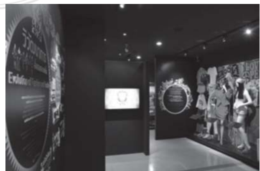
รูปที่ 3 นิทรรศการในส่วนลำดับยุคสมัยของสิ่งทอและแฟชั่น