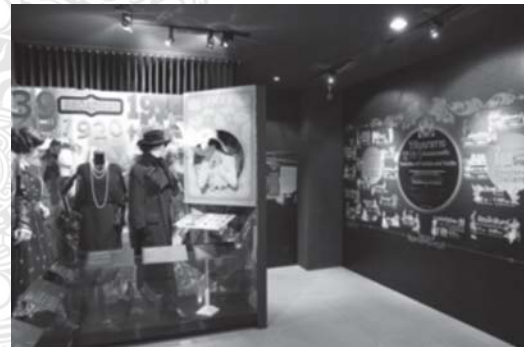
รูปที่ 2 นิทรรศการในส่วนวิวัฒนาการสิ่งทอและแฟชั่น