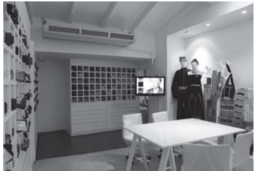
รูปที่ 6 นิทรรศการในส่วนห้องสืบค้นข้อมูลทางวัสดุสิ่งทอ