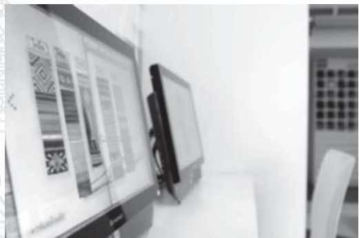
รูปที่ 7 นิทรรศการในส่วนห้องสืบค้นข้อมูลทางวัสดุสิ่งทอ