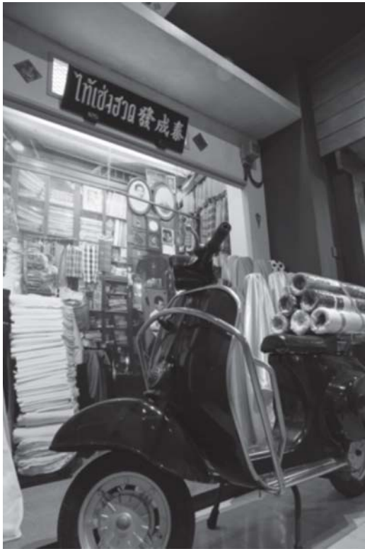
รูปที่ 4 นิทรรศการในส่วน “ลำเพ็ญ” ย่านแห่งแรงบันดาลใจ