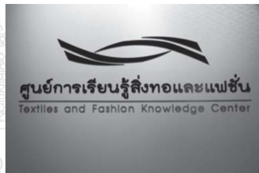
รูปที่ 1 ศูนย์การเรียนรู้สิ่งทอและแฟชั่น