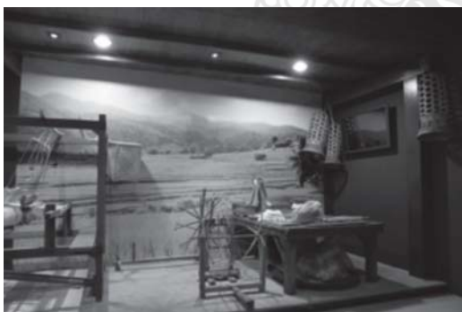
รูปที่ 5 นิทรรศการในส่วนวิถีชีวิตพื้นบ้าน

แผนงาน : ส่วนห้องสมุดสำหรับการสืบค้นข้อมูล แนวทางการจัดทำโครงการ/กิจกรรม :